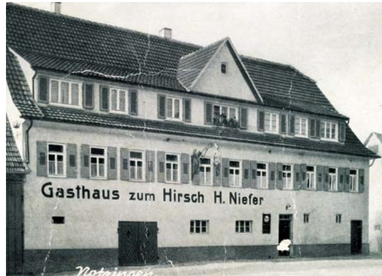
Ehemaliges Gasthaus zum Hirsch, heute ARCHE Wohnverbund

Auch konnten sich im Gewerbegebiet erfolgreich Unternehmen ansiedeln.