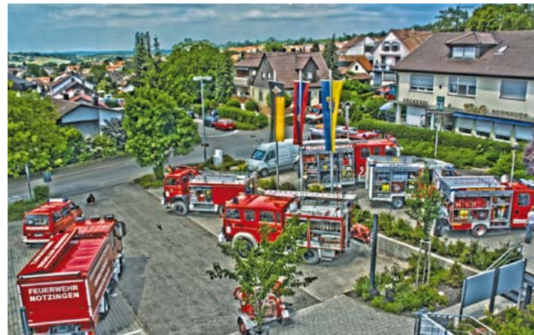
Fahrzeugausstellung der Feuerwehr