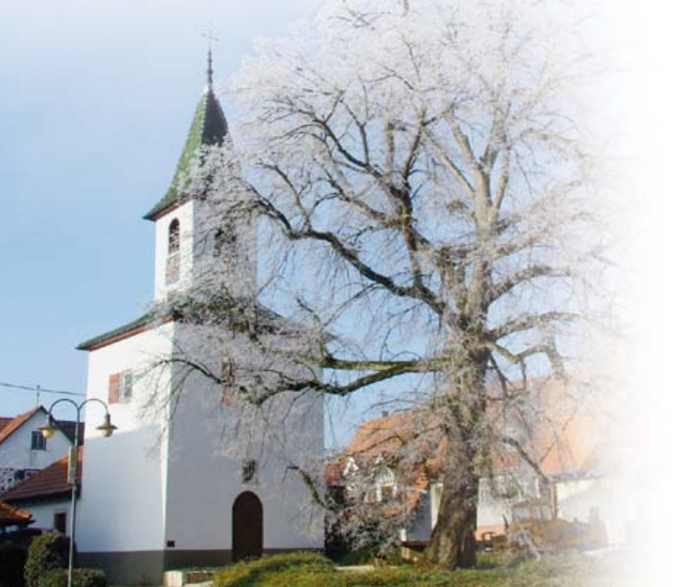
Wellinger Kirchle – Dorfmuseum