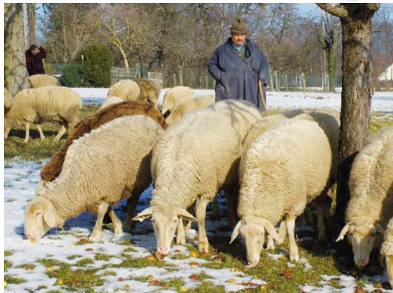
Schafe im Eichert

An den Bushaltestellen sind die Fahrpläne angeschlagen.